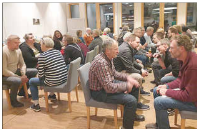
Rückblick Speed-Networking auf unserem ersten Eider-Schnackabend.