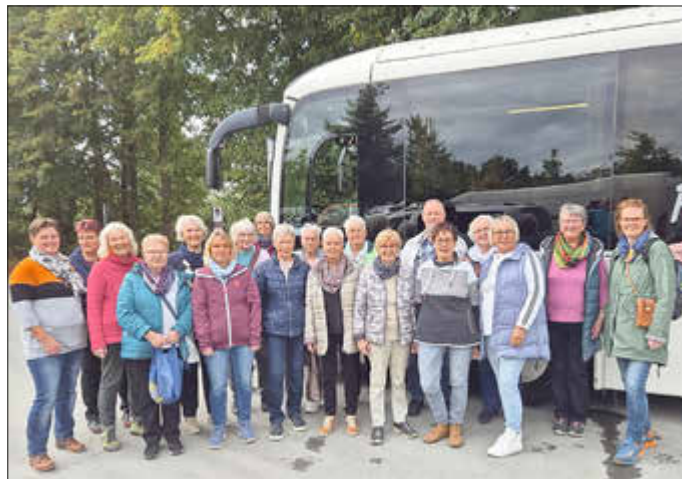
Samstag, 04. Januar bis Samstag, 11. Januar 2025

Für die Landfrauen verging der Tag viel zu schnell, gab es doch so viele tolle Sachen zu bestaunen. Und auch das kulinarische Angebot sprach die Reisegruppe an. Mit vielen neuen Eindrücken, Ideen und Einkäufen ging es am späten Nachmittag zurück nach Hennstedt.