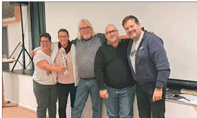
Das Siegerteam „Sexyheistedt,“

Fragen aus vielen Bereichen stellten die „Quizer“ wieder vor Herausforderungen. Diesmal ging es z.B. um Singular & Plural, um die Gesundheit, Tierwelt und unsere Heimat. Im Laufe des Abends hörte man viele „Ahhh's“ und „oh Nee's“ im Saal.