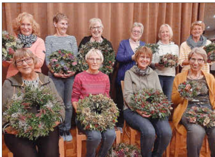
Die stolzen LandFrauen mit ihren Kränzen