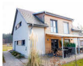
🏠 95 m 2 👤 6 🍳 3 🛏️ 2 ANITA