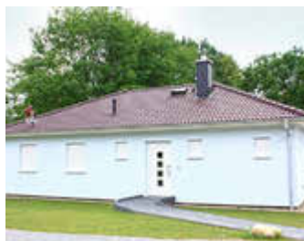
🏠 100 m 2 👤 6 🍳 3 🛏️ 1 SEEBLICK I