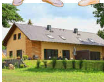
🏠 145 m 2 👤 6 🍳 3 🛏️ 2 AGA-SEEROMANTIK