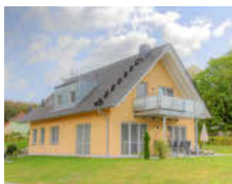
🏠 104 m 2 👤 4 🍳 2 🛏️ 1 OHANA EG