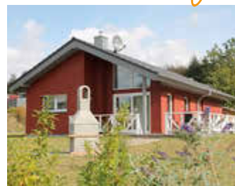
🏠 104 m 2 👤 6 🍳 3 🛏️ 2 TRINE