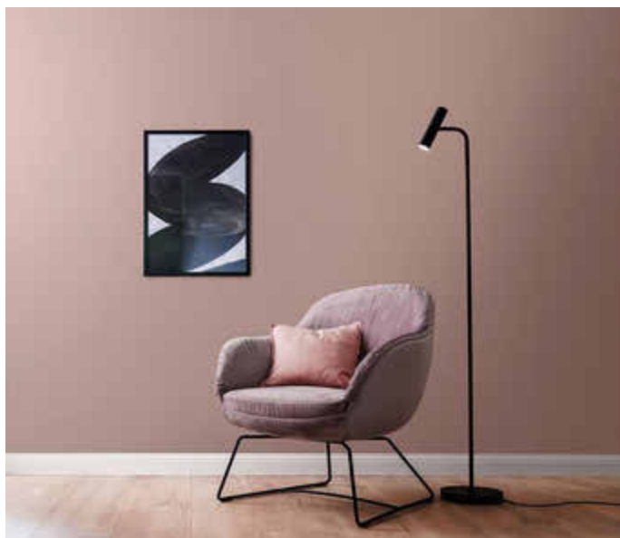
Die Designfarbe Pfingstrosenrosé bringt Wärme und Eleganz in jeden Raum.

(djd). Erst der persönliche Stil macht aus vier Wänden ein Zuhause. Entscheidenden Einfluss an der Atmosphäre eines Raums haben die Wandfarben. Für eine einfache Orientierung bei der Auswahl umfassen etwa die Schöner Wohnen Designfarben die sechs wichtigsten Farbfamilien in jeweils fünf Varianten. Aufgrund der Spritzfrei-Formel und der hohen Deckkraft lassen sie sich einfach, schnell und sauber auftragen. Die edel-matte Optik der sorgfältig kuratierten Farben überzeugt ebenso wie die angenehme Haptik. Da die Wandfarben frei von Lösemitteln, Weichmachern und Konservierungsmitteln sind, fördern sie zudem ein nachhaltiges und gesundes Wohnen. Unter www.schoener-wohnen-farbe.com etwa gibt es mehr Informationen dazu sowie nützliche Verarbeitungstipps.