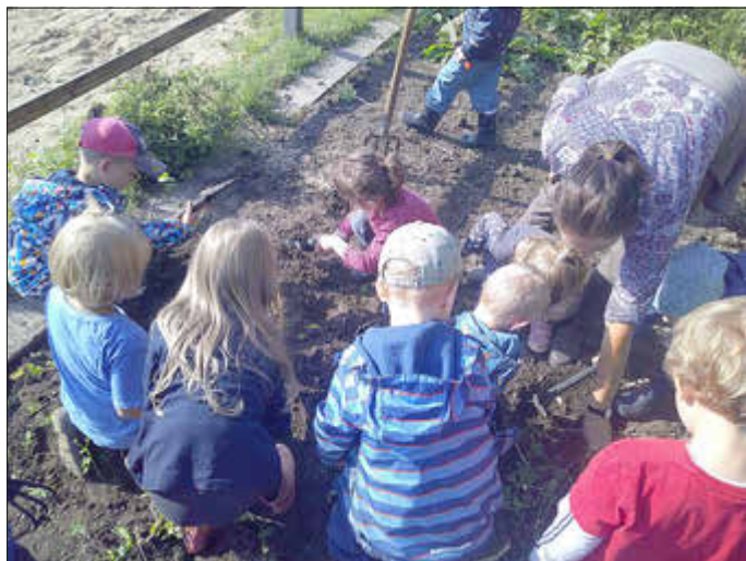
Kinder bei der Kartoffelernte

Kindergarten, wo alle nach und nach abgeholt wurden. Es war ein rundum gelungener Ausflug!