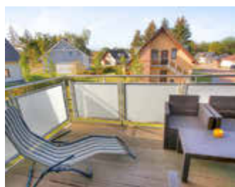
🏠 95 m 2 👤 4 🍳 2 🛏️ 1 OHANA DG