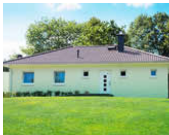
🏠 100 m 2 👤 6 🍳 3 🛏️ 1 SEEBLICK II