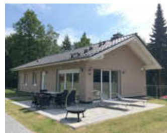
🏠 78 m 2 👤 4 🍳 2 🛏️ 2 KERSTIN