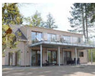
🏠 89 m 2 👤 2 🍳 1 🛏️ 1 EDITH PANORAMA