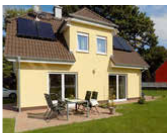
🏠 100 m 2 👤 4 🍳 2 🛏️ 2 SEESCHWALBE