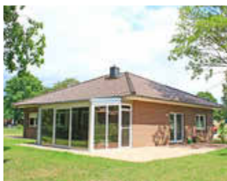
🏠 110 m 2 👤 4 🍳 2 🛏️ 1 DIANA