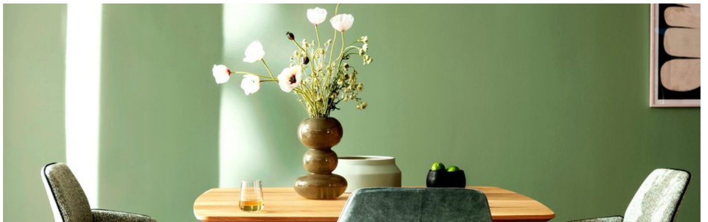
Mit angesagten Trendfarben für die Wand erhält das Zuhause im Handumdrehen eine neue Ausstrahlung. Der Farbton Olive vermittelt Naturverbundenheit und Frische.

ziergang am Meer erinnert. Für Wüstenwärme an den Wänden ist das Terrakotta-Braun von Arizona verantwortlich, während Crema, angelehnt an die Farbe einer guten Espressocrema, für entspannte Momente sorgt. Der sanfte Grünton Olive bringt eine Atmosphäre der Ruhe, während Universe ins All entführt. Unter www.schoener-wohnen-farbe.com gibt es einen Überblick zu allen Trends.