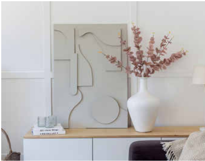
Ein selbst entworfenes Reliefbild wird in jedem Raum zum neuen Blickfang.