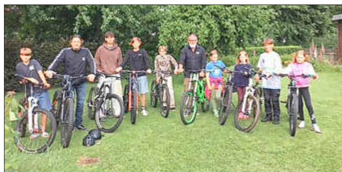
Die Crew ist von Anfang an dabei.

Zum 25-jährigen Jubiläum der Flusslandschaft Eider-Treene-Sorge wurde die Regionalmarke einer Überarbeitung unterzogen. In diesem Zuge hat sich die AktivRegion Eider-Treene-Sorge entschieden, ihren Außenauftritt ebenfalls anzupassen. Das frische und moderne Design ist an die Farben der Flusslandschaft angepasst, so dass ein Wiedererkennungswert vorhanden ist. Das neue Logo wurde auf der Vorstandssitzung vorgestellt und wird sukzessive ausgetauscht.