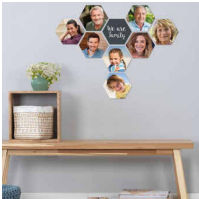
Ahnengalerie im individuellen Look: Fotos der liebsten Verwandten schmücken jedes Zuhause.

(djd). Eine Familienchronik stellt buchstäblich eine Schatztruhe dar, die über Generationen hinweg die Liebe zu Verwandten aus vorigen Zeiten weiterträgt und das Wissen über die Ahnen aufbewahrt. Einen besonderen Platz darin nehmen alte Fotos ein. Sie illustrieren herausragende Familienereignisse, halten die Erinnerung an Anekdoten wach und erzählen die Geschichte der Vorfahren. Ob als Chronik in einem Fotobuch oder als Ahnengalerie an der Wand – mit den Tipps und Produkten von Cewe geht die Umsetzung leicht von der Hand. So lassen sich alte, analoge Bilder unkompliziert digitalisieren, während beispielsweise über den kostenlosen Onlinespeicher Cewe myPhotos auch mehrere Familienmitglieder gemeinsam an der Familienchronik arbeiten können.