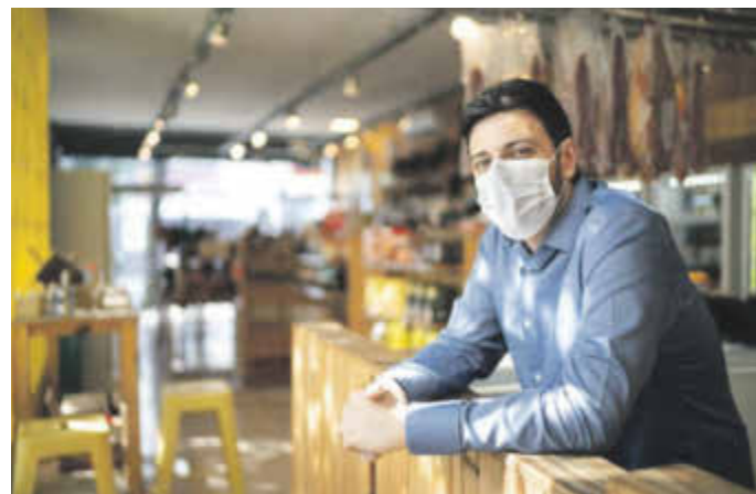
Mit den negativen Folgen der Corona-Pandemie haben manche Branchen schwer zu kämpfen. Gleichzeitig gibt es aber auch Jobs, die gefragt sind denn je.