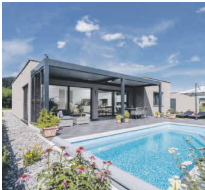
Bauen mit Holz ist nachhaltig und geht auch individuell.

steller WeberHaus etwa sorgt eine ökologische Gebäudehülle aus Holz für einen hervorragenden Wärme-, Kälte- und Schallschutz und legt damit die Basis für einen niedrigen Energieverbrauch. Daneben punkten die Häuser des badischen Herstellers mit energiesparender Haus- und Heiztechnik. Sie sind standardmäßig mit einer Photovoltaikanlage mit Speichersystem sowie mit Frischluft-Wärmetechnik und einer smarten Haussteuerung ausgestattet. Infos gibt es unter www.weberhaus.de .