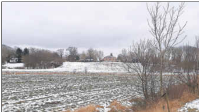
Aufnahme von Westermoor kommend

Klasse, dass dieser immer noch zugänglich geblieben ist!