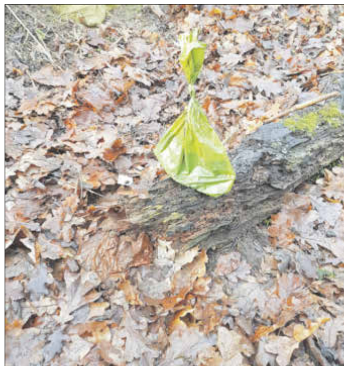
Dörpling Bahndamm, 27.01.2021