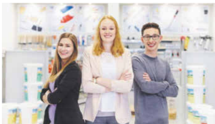
Kaufleute im Groß- und Außenhandelsmanagement sind im direkten Kundenkontakt die Visitenkarte eines Unternehmens.

(djd). Kaufleute für das Groß- und Außenhandelsmanagement sind die Visitenkarte eines Unternehmens: Sie stehen im direkten Kundenkontakt, beraten und informieren. Die Vielseitigkeit des Ausbildungsberufs macht ihn bei Schulabgängern beliebt. Hinzu kommen Möglichkeiten, sich nach dem Abschluss weiterzubilden