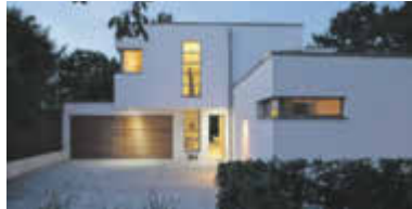
Dynamisches Duo: Für dieses Einfamilienhaus im Stil der klassischen Moderne kamen Kalksandstein und Porenbeton zum Einsatz.

(djd). Die Studie einer großen Bausparkasse ergab: Der Wunsch nach dem Erwerb einer Immobilie wurde bei fast einem Drittel der Mieter in Deutschland über den vergangenen Sommer hinweg deutlich größer. Sie wünschen sich mehr Platz für die ganze Familie, einen Ort zum Arbeiten, für die Kinder zum Spielen oder auch um einmal nur für sich zu sein. Diese Bauherren in spe wollen vor allem bezahlbar bauen. Dazu wohngesund und flexibel genug, um auf neue Situationen reagieren zu können, etwa mit einem Um- oder Anbau. "Massives Mauerwerk beispielsweise erfüllt diese Anforderungen bestmöglich", erklärt Dr. Ronald Rast, Geschäftsführer der Deutschen Gesellschaft für Mauerwerks- und Wohnungsbau (DGfM). Mehr Infos zur Massivbauweise gibt es etwa auf www.mauerwerk.online und www.massiv-mein-haus.de .