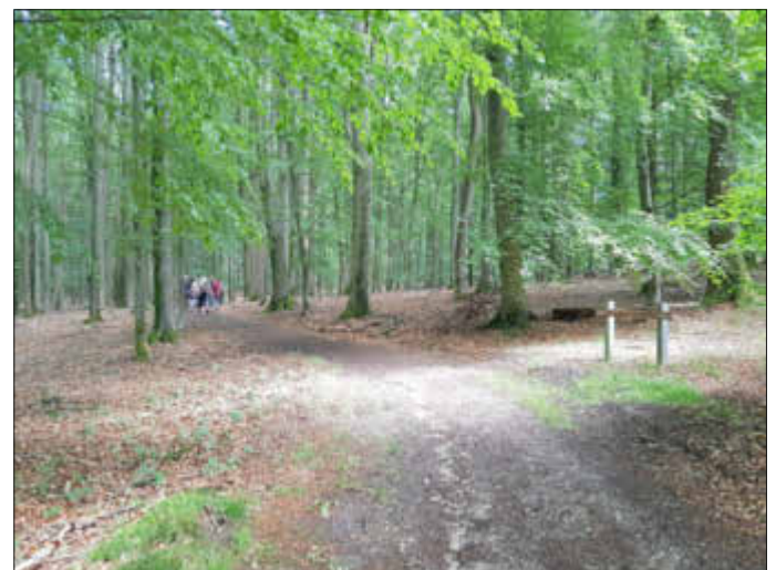
Der 18 km lange Klaus-Groth-Wanderweg von Heide nach Tellingstedt ist beliebt bei Groß und Klein.