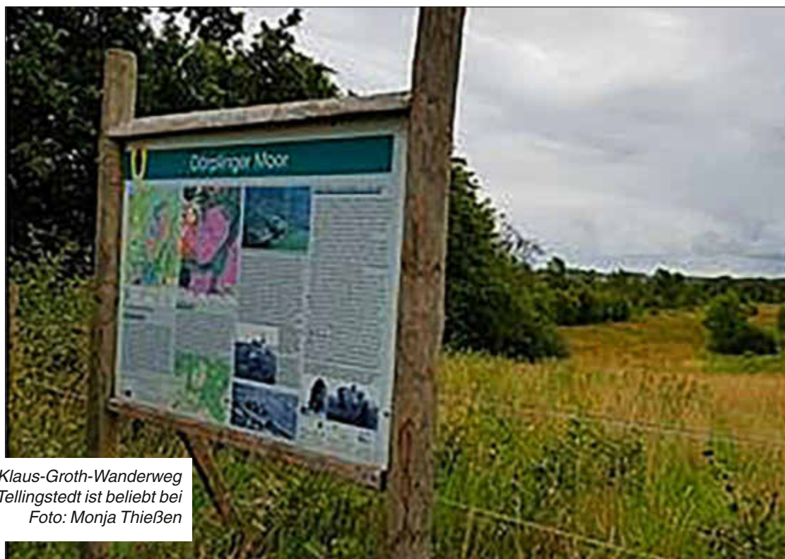
Der 18 km lange Klaus-Groth-Wanderweg von Heide nach Tellingstedt ist beliebt bei Groß und Klein.

#digitalepostkarte #fotogruss #botschafter #lieblingsplatz #moor #wandemmachtglücklich #echteider