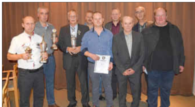
Die erfolgreichsten Angler der abgelaufenen Angelsaison.