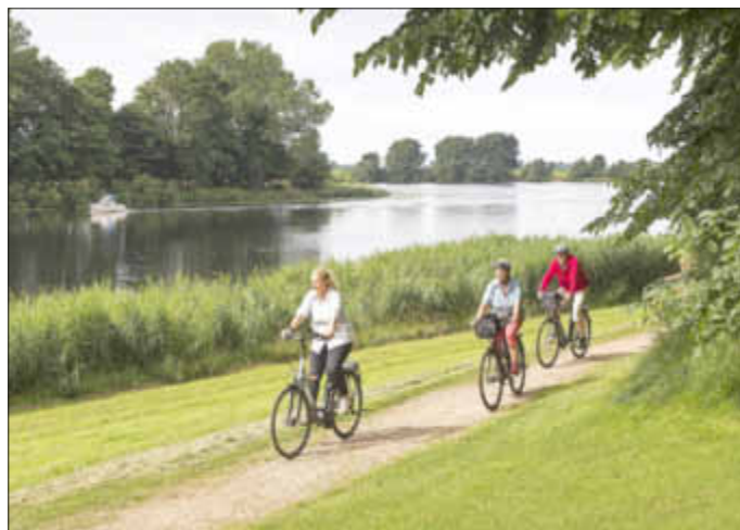
Radfahren am längsten Fluss Schleswig-Holsteins: Die Eider zieht sich mit ihren zahllosen wie malerischen Schleifen durch die Region.

Wer den Eider-Treene-Sorge-Radweg mit dem Rad erkunden oder einfach nur nach Ausflugszielen stöbern möchte, findet alle Informationen auf www.ets-radweg.de .