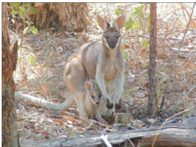
Plötzliche Begegnung im Outback

Interessierte sind herzlich eingeladen. Beginn ist um 14:30 Uhr im Gemeindehaus.