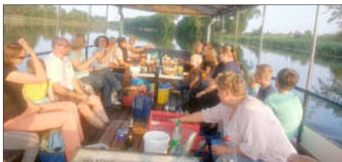
Auf dem Weg nach Pahlen

Bei schönem Spätsommerwetter starteten die Königinnen und Könige des Hollingstedter Dorffestes 2018 mit ihren Angehörigen und Freunden mit der Bargener Fähre zur traditionellen Königsfahrt auf der Eider vom Fähranleger Delve-Schwiehhusen.