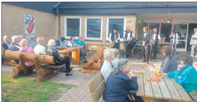
Die Delv Town Jazzmen in Aktion.

Delve/ Dithmarscher Akkordeonorchester und Delvtown Jazzmen musizieren beim zweiten Sommerkonzert des Förderverein Wi für uns e.V. in der Sporthalle im MarktTreff in Delve. Liebhaber handgemachter Musik kommen voll auf ihre Kosten. Der Förderverein Wi für uns e.V. hatte unter dem Motto „Akkordeon- und Jazzklänge – ein musikalisches Kontrastprogramm“ zu ihrem zweiten Sommerkonzert nach Delve in den MarktTreff der Gemeinden Delve/Hollingstedt eingeladen und damit nicht zu viel versprochen.