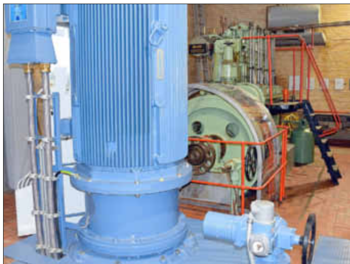
Blick in das Innere des Schöpfwerks mit seinen modernen Pumpen und dem alten Schiffsdiesel.

Doch auch die neuen Pumpen sind einen Blick wert. Alle Geräte zusammen können etwa 7.000 Liter Wasser pro Sekunde in die Eider pumpen. Ein herkömmlicher Tankwagen wäre demnach binnen weniger Sekunden problemlos zu befüllen. Die Druckrohre durch den Deich haben jeweils einen Durchmesser von 0,9 bis 1,2 Meter. Und die bis zu acht Tonnen schweren Motoren weisen eine beachtliche Leistung bis zu 350 Kilowatt auf. Das Schöpfwerk ist für die Entwässerung eines 3.224 Hektar großen Gebietes südlich der Eider zuständig, das in Altensiel mit 703 Hektar und Neuensiel mit 2.521 Hektar unterteilt ist.