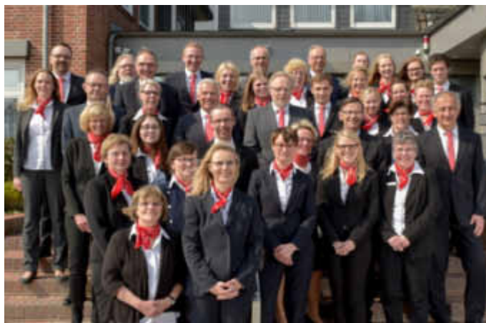
Ein Teil der Mitarbeiterinnen und Mitarbeiter am Standort Hennstedt

Wir sind überzeugt, dass wir mit den bekannten Mitarbeitern hier vor Ort unsere Beratungsqualität, die bereits mehrfach ausgezeichnet worden ist, weiterentwickeln und damit unseren Kunden noch mehr bieten können. Wir möchten weiter DER finanzielle Wegbegleiter unserer Kunden in allen Lebensphasen sein und freuen uns darauf, unsere Kunden weiter zu betreuen und mit Neukunden ins Gespräch zu kommen.