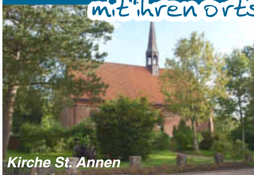
Kirche St. Annen

mit ihren ortsansässigen Firmen stellen sich vor