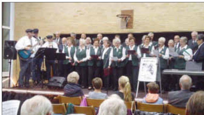
Ein Highlight 2017: Im Bild der Auftritt der Büttpedders mit den Delver Chören beim letzten Plattdeutschen Abend.