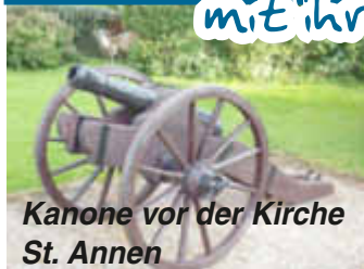
Kanone vor der Kirche St. Annen

mit ihren ortsansässigen Firmen stellen sich vor