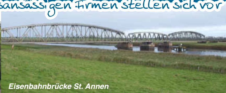
Eisenbahnbrücke St. Annen