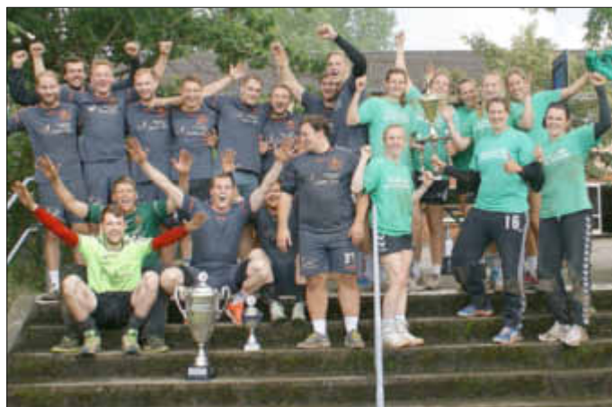
Das sind die diesjährigen Sieger des A-Pokals

Frauen A-Pokal Sieger ist „Waldmeister der Herzen“, eine Vertretung aus Steinburg, bei den Männern gewann das „Krampfandergereschwader“, eine Vertretung aus Schülpe, Rendsburg, Westerrönfeld, den A-Pokal.