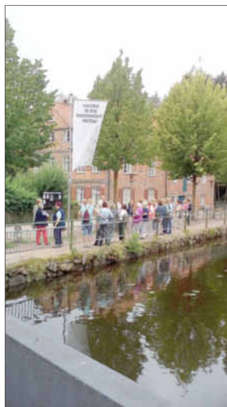
Mit dem Bus ins Lauenburgische

(RH) 40 LandFrauen aus Tellingstedt machten sich auf nach Gut Basthorst und „Büthenwarder“