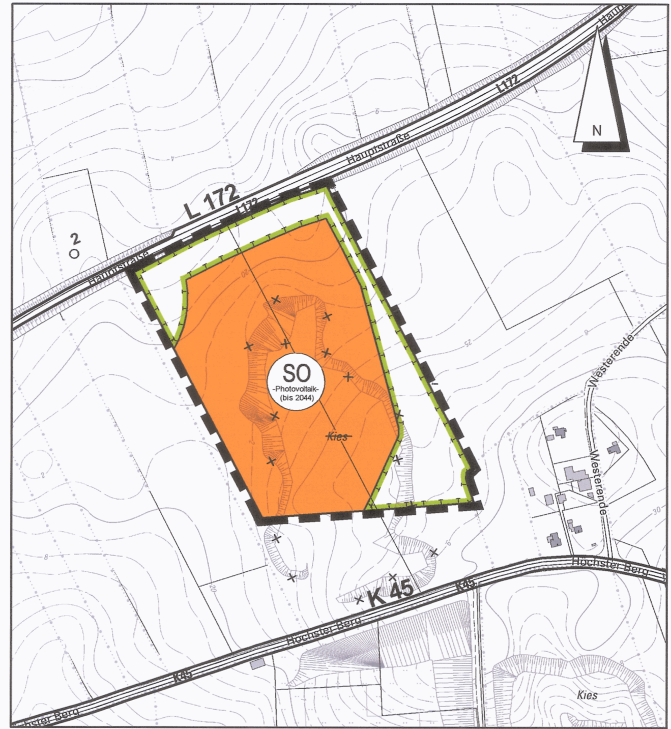
Kreis Dithmarschen - Gemeinde Pahlen © GeoBasis-DE/L VermA-SH (www.lverma.schleswig-holstein.de) Gemarkung Pahlen - Flur 11

Es gilt die BauNVO von 1990/93 DTK 5, Maßstab 1 : 5000