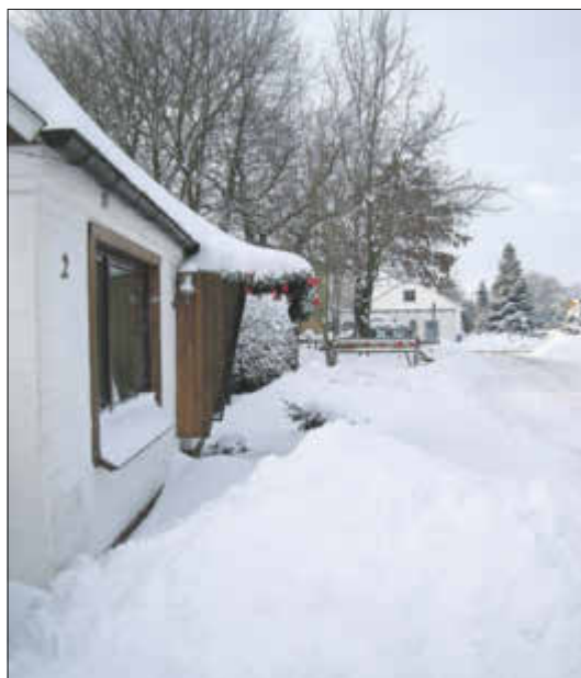
Dörpling im Winter 2010