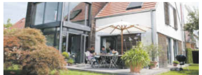
Nachhaltiges und umweltbewusstes Bauen liegt im Trend - von der Fassadengestaltung bis zur Wärmedämmung unterm Dach.