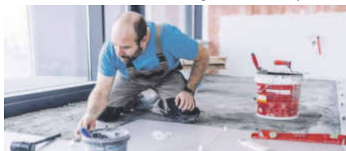
Wer bei der Arbeit ständig in kniender Position verharren muss, hat ein erhöhtes Risiko für Arthrose.

(djd). Wir sollen immer länger arbeiten. Bereits jetzt wird in Deutschland über die Rente mit 70 debattiert. Dabei stellt sich mitunter die Frage: Wie soll man das schaffen - gerade in Berufen, die körperlich sehr fordernd sind? Denn Jobs im Handwerk, in der Pflege oder Forstwirtschaft oder auch der Bewegungsmangel im Büro können Arthrose begünstigen. Um lange berufsfitt zu bleiben, ist daher Ausgleich wichtig - zum Beispiel durch schonende Bewegung wie Schwimmen, Radfahren, Yoga oder Gymnastik. Auch sollte man bei den ersten Anzeichen von Gelenkproblemen zum Orthopäden gehen und sich behandeln lassen. So können Hyaluronsäureinjektionen wie die Synvisc 3-in-1-Spritze gegen Arthrose Beschwerden lindern und den Krankheitsverlauf bremsen. Mehr dazu gibt es unter www.synvisc.de .