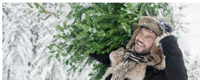
Umweltfreundlich: Am besten wählt man einen Baum aus ökologischem Anbau oder vom heimischen Förster vor Ort aus.

(djd). Weihnachten ressourcenschonender feiern? Mit etwas Umdenken kann das schon dieses Jahr klappen. Zum Beispiel, indem man einen Weihnachtsbaum mit FSC-Siegel aus der Region wählt. Das Siegel garantiert, dass der Baum aus einem Betrieb mit umwelt- und sozialverträglicher Waldwirtschaft stammt. Auch der Baumständer kann umweltfreundlich sein. Der Green Line M von Krinner etwa ist der weltweit erste Ständer aus recyceltem Plastikmüll. Er wird nachhaltig und ressourcenschonend in Niederbayern hergestellt. Wer Lichterketten und Co. benutzt, sollte zu energiesparenden LED-Varianten greifen und den Baum erst abends „leuchten“ lassen. Und warum nicht mal nett dekoriertes Recycling- und Packpapier für das Verpacken der Geschenke verwenden?