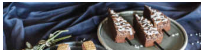
Wie die festliche Tafel und die restliche Wohnung sollten auch die Weihnachtskuchen stimmungsvoll dekoriert werden.

Mit Rosmarinzweigen und Cranberrys kann man die „Sahnetorte Preiselbeere-Spekulativus“ im Handumdrehen in einen Weihnachtskranz verwandeln. Damit wird er zum Hingucker auf der adventlichen Kuchentafel. Tipp: Da Rosmarin einen intensiven Eigengeschmack hat, sollte man das Kraut beim Verzehr wieder vom Kuchen nehmen.