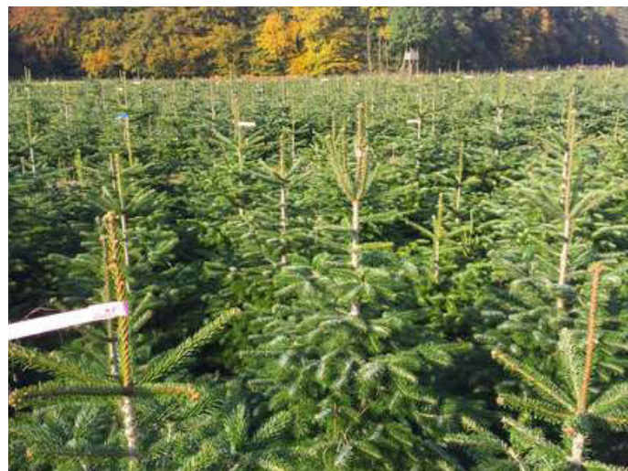
Ein Hektar Weihnachtsbaumkultur filtert in zehn Jahren rund 145 Tonnen Kohlendioxid aus der Luft, speichert den Kohlenstoff im Holz und produziert etwa 100 Tonnen Sauerstoff.

(djd). Alle Jahre wieder dieselbe Grundsatzfrage: Welcher Weihnachtsbaum soll es diesmal sein? Tanne, Fichte oder Kiefer? Natürlich oder künstlich? Im Sinne des Klimaschutzes, das haben Studien bewiesen, sollte man sich für einen Naturbaum entscheiden. Der Plastikbaum hat ein Umweltproblem: Er ist biologisch nicht abbaubar, weil er häufig aus PVC oder Polyethylen besteht. Einer kanadischen Studie zufolge produziert der durchschnittliche Plastikbaum rund 48 Kilogramm CO2 bei Herstellung, Transport und Entsorgung. Jeder Naturbaum dagegen ist grundsätzlich CO2-neutral. Viele Infos zum Thema gibt es beim Verband Natürlicher Weihnachtsbaum e. V. unter www.vnwb.de .