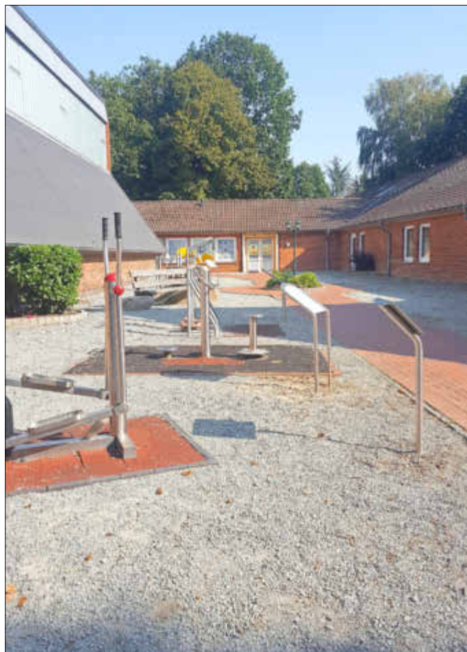
Generationenpark (im Vordergrund: Ganzkörper- und Torso-trainer)