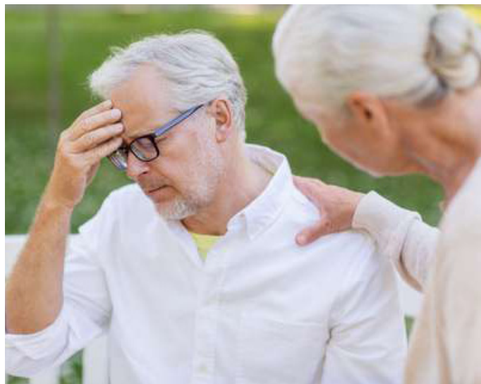
An heißen Sommertagen kommt es gerade bei Senioren öfter zu Problemen mit Schwindel und Benommenheit.

Gerade Senioren sollten bei warmen Temperaturen außerdem darauf achten, reichlich zu trinken, um das Blut möglichst dünnflüssig zu halten. Dies wird häufig vergessen, da im Alter das Durstgefühl nachlässt. Ein Tipp dagegen: Immer ein Glas Wasser in Reichweite stehen haben und nach dem Trinken gleich wieder auffüllen. Wer Wasser zu langweilig findet, kann sich auch mit Fruchtsaftschorlen, Kräuter- und Früchtetees zu einem regelmäßigen Schluck animieren.