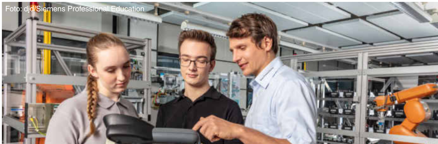
Eine technische Ausbildung oder ein technisches duales Studium sind der Einstieg in attraktive Berufe. Sie bieten die Grundlage, um sich beruflich auch künftig in einer digitalen Welt sehr erfolgreich weiterentwickeln zu können.

Wir sind ein erfolgreiches und expandierendes Unternehmen im Verlagswesen und geben monatlich über 75 Mitteilungsblätter für Städte und Gemeinden in Mecklenburg-Vorpommern und Schleswig-Holstein sowie verschiedene Sonderpublikationen heraus.