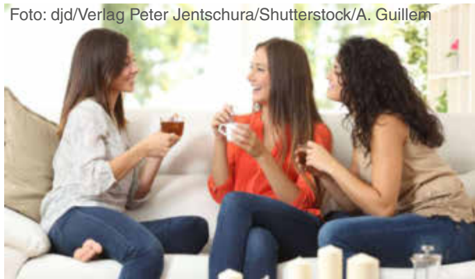
Gute Tee-Rezepte für die Gesundheit haben das ganze Jahr über Saison.