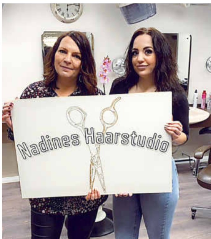
- Anzeige -

Ein herzliches Dankeschön an all unsere Kunden, die uns ihr Vertrauen und vor allem die Treue halten. Wir freuen uns auf euren Besuch und bieten an: