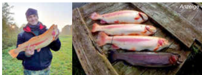
- Anzeige -

Besuchen Sie gern unseren Angelsee Tellingstedt. Wir haben von April bis September von 5.00 Uhr bis 22.00 Uhr und von Oktober bis März in der Zeit von 6.00 Uhr bis 19.00 Uhr für Sie geöffnet. Wir freuen uns auf alle kleinen und großen Angelfreunde!