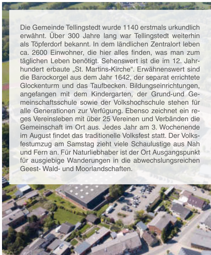
Luftaufnahme von Tellingstedt

Schauen Sie gern persönlich bei uns vorbei oder senden Sie uns Ihre Bewerbung – wir freuen uns!