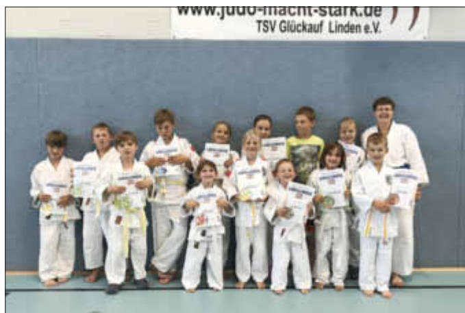
Ein Teil der Sparte präsentiert die neuen Abzeichen

Auch dieses Jahr führte die Judosparte des TSV Linden eine Judosafari durch. Erste Punkte konnten die Kinder im Wettkampf als japanischem Turnier gewinnen. Dann folgte die Leichtathletik mit Laufen, Springen und Werfen. Letzte Punkte gab es durch den kreativen Parcours, hier wurde nochmal alles gegeben. Auch wenn der schwarze Panther dieses Jahr nicht vergeben werden konnte, hatten alle Teilnehmer viel Spaß.