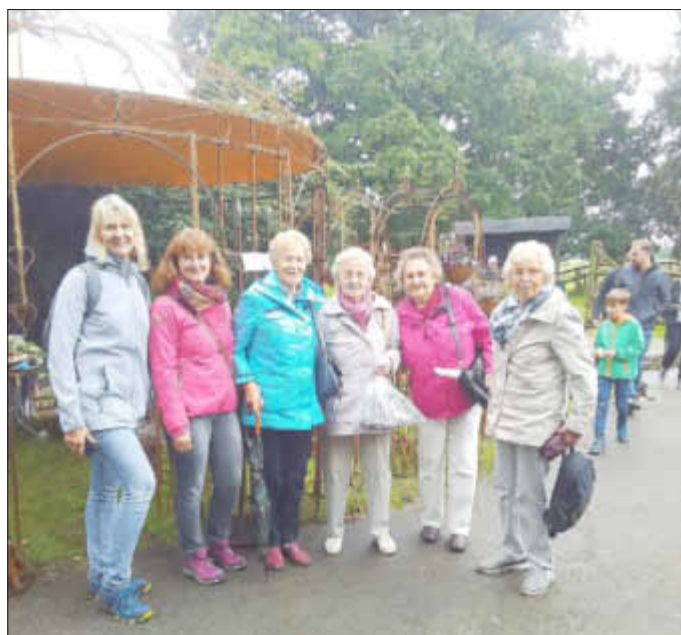
Besuch des Outlet-Centers in Neumünster und Hof Bissenbrook

(MM). Anfang September ging es an einem Samstagvormittag mit dem Bus zum „Herbstzauber“ Richtung Neumünster. Leider waren die Herbstfarben an diesem Tag nur grau in grau. Trotzdem tat es der Stimmung der LandFrauen im Bus keinen Abbruch, es ging fröhlich und gut gelaunt los. Der erste Stopp war das Designer Outlet-Center in Neumünster, das zum shoppen und bummeln einlud.