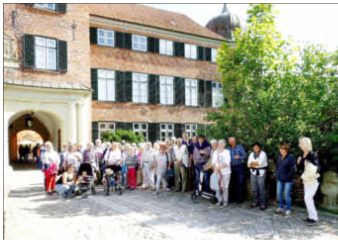
Gruppenbild der Tagesgäste vom DRK Wrohm-Süderdorf vor dem Eutiner Schloss

An einem herrlichen Sonntag fuhren 51 Teilnehmer frohgelaunt und singend in einem vollen Reisebus nach Eutin. Für Unterhaltung sorgten ein paar Geschichten, die im Bus vorgelesen wurden. Zuerst fuhr der Busfahrer Horst die Tagesgäste zur Alten Mühle, wo richtig schön zünftig zu Mittag gegessen wurde.