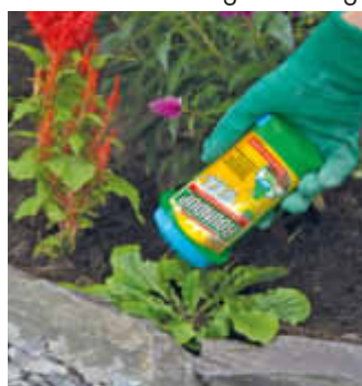
Punktgenaue Anwendung in Beeten

und überlegte Maßnahmen erfordern. Die Roundup® Speed Fertigmischung zur Verwendung im Drucksprühergerät macht schnell reinen Tisch auf der grünen Fläche zur Vorbereitung der Rasenneuanlage. Zur Bekämpfung vereinzelter Unkräuter im Rasen wie Löwenzahn oder Hirse sollte hingegen eine pointiertere Anwendung zum Zuge