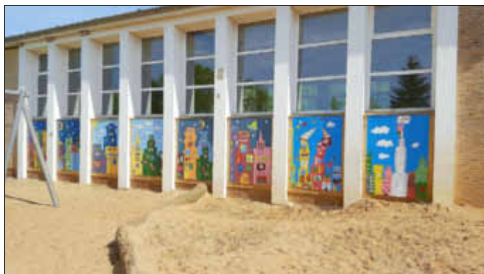
Neben vielen anderen großen Arbeiten während der Aktion entstand das längste Graffiti Dellstedts an der Turnhalle.

Wir freuen uns sehr über so viel Einsatz und bedanken uns ganz herzlich für die tolle Zusammenarbeit und allen Spendern, die diese Aktion möglich machten!