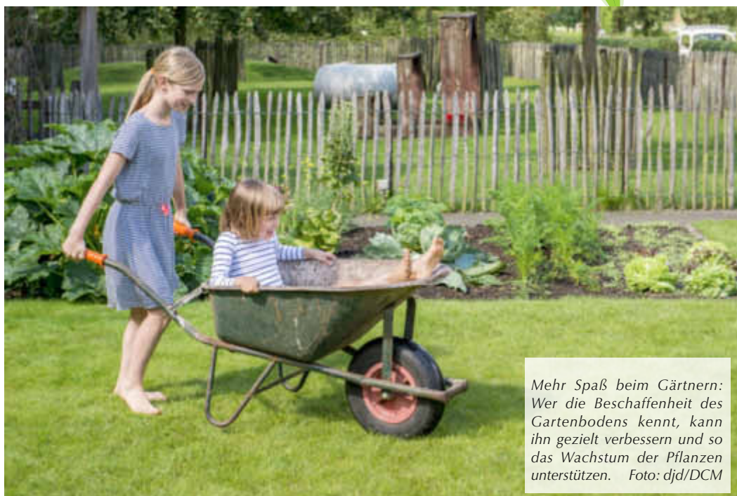
Mehr Spaß beim Gärtnern: Wer die Beschaffenheit des Gartenbodens kennt, kann ihn gezielt verbessern und so das Wachstum der Pflanzen unterstützen.