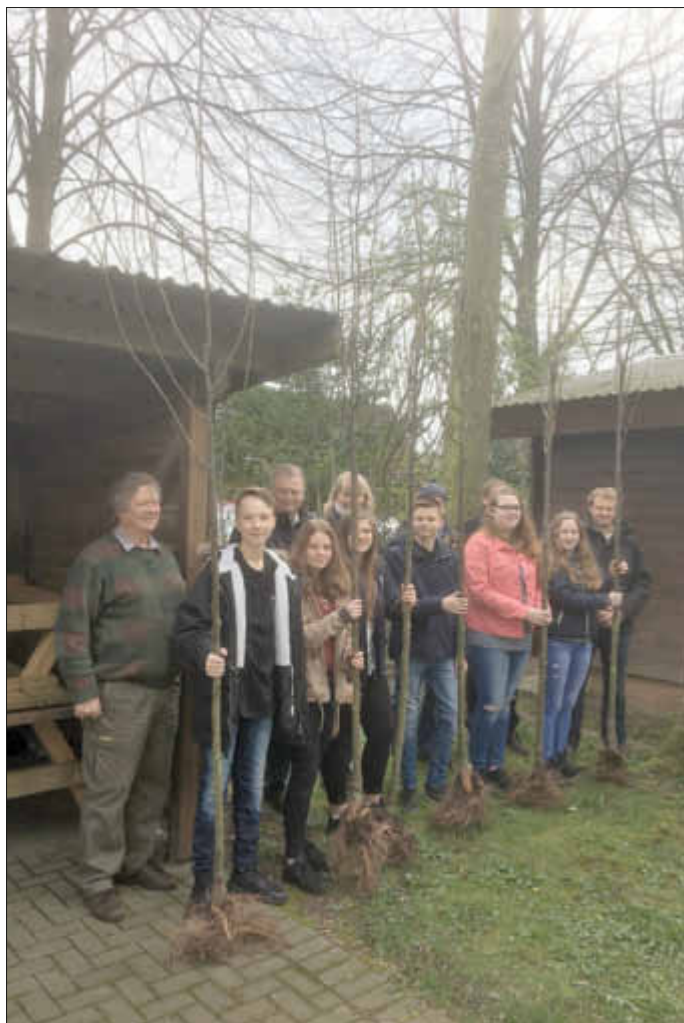
Gemeinde Linden Kulturausschuss Linden