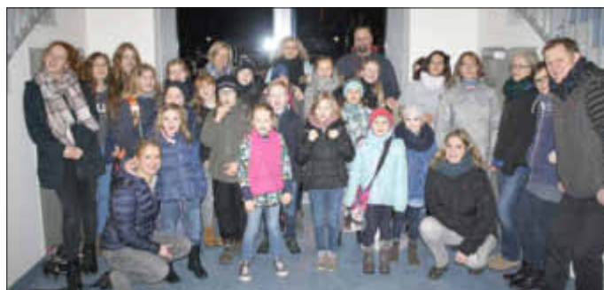
Gemeinschaftsbild im Elbe Ice Stadion Brokdorf

dieses Event wollten sich die Läuferinnen und Läufer nicht nehmen lassen, als sie am 10.03.2017 zur Eisdisco nach Brokdorf gefahren sind. Bei lauter, aber guter Musik, zogen sie ihre Runden. Ohne größere Blessuren konnte gegen 22:00 Uhr der Bus die Rücktour antreten. Fazit der Gruppe war: es war lustig, aber auch ein bisschen zu voll.