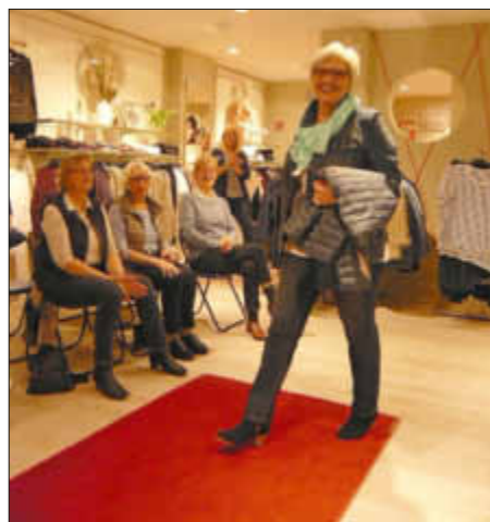
Model sein macht Spass

Im kommenden Jahr, so waren sich die LandFrauen einig, soll es gerne eine Wiederholung geben.