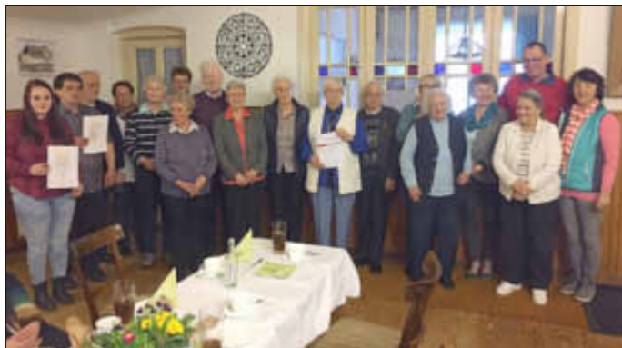
Ein Teil der geehrten Mitglieder bei der Mitgliederversammlung in Delve