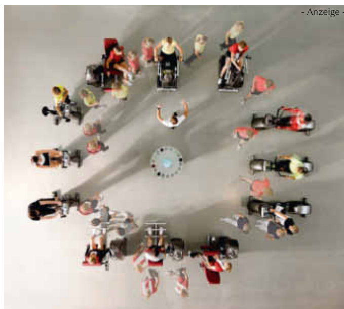
- Anzeige -