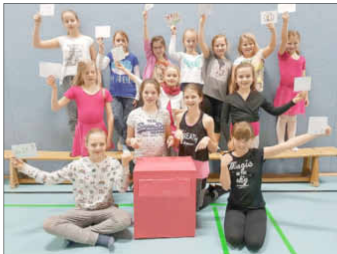
Bewerbung Sportjugendpreis 2016;praktischer Teil

Es fällt schwer zu glauben, dass es in Sportvereinen, die als Entfaltungsraum für Kinder und Jugendliche gedacht sind, zu Belästigungen, Übergriffen oder erzwungenen sexuellen Handlungen kommen kann, aber Täter setzen gezielt auf das Vertrauen, das ihrer Position als Trainer im Verein, von den Minderjährigen, entgegengebracht wird und missbrauchen dieses. Den Eltern ist es wichtig, ihre Zöglinge in guter Obhut zu wissen und die Akteure des TSV Linden sind sich dieser Verantwortung bewusst!