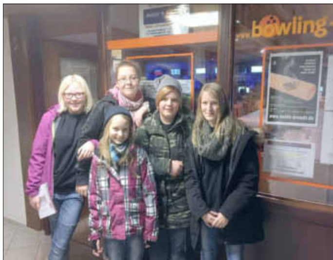
Die Mädchen der Jugendfeuerwehr.

Zum 10.12.2016 lud die Jugendfeuerwehr Pahlen Schalkholz seine Mitglieder zur alljährlichen Weihnachtsfeier ein.