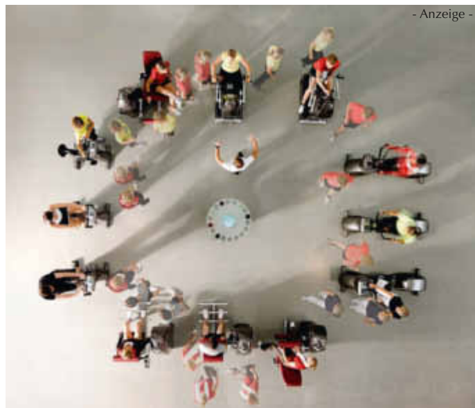
- Anzeige -

Sport ist gesund – allerdings waren kanadische Forscher davor, sich völlig zu verausgaben, um auf diesem Weg aufgestaute Wut abzulassen. Nach den Erkenntnissen der Forscher kann die Kombination von körperlicher Anstrengung und negativen Emotionen ähnliche Auswirkungen auf den Körper haben wie ein Herzinfarkt. Dazu zählen etwa ein ansteigender Puls, ein unterbrochener Blutfluss und eine verlangsamte Blutversorgung. Diese Faktoren erhöhen das Risiko, einen Herzinfarkt zu erleiden, um das Doppelte.