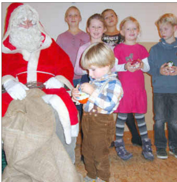
Der Weihnachtsmann belohnte alle Kinder, die mutig ihre Gedichte vortrugen.